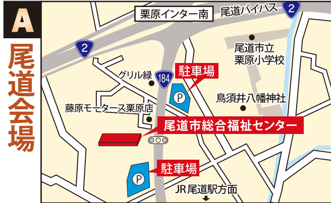
尾道市門田町 22 番 5 号 TEL: 0848-22-8385